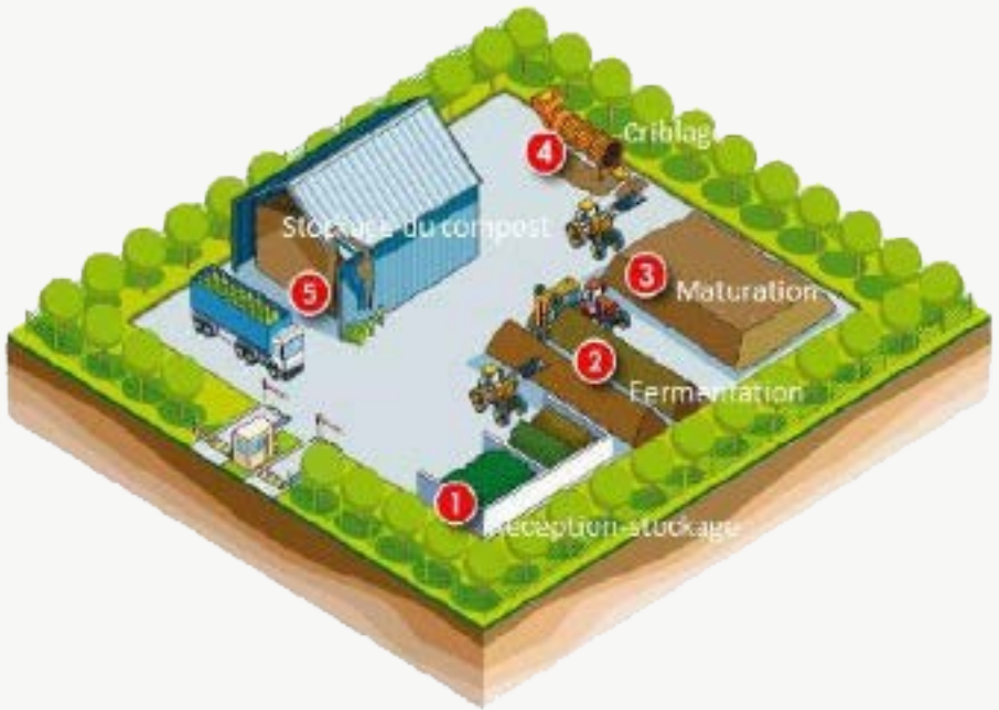
Schéma montrant les différentes étapes de production de compostage

Quelle que soit la taille de la plate-forme, le type de déchet traité et les différentes techniques mises en œuvre, la succession des étapes est commune à toutes les installations.